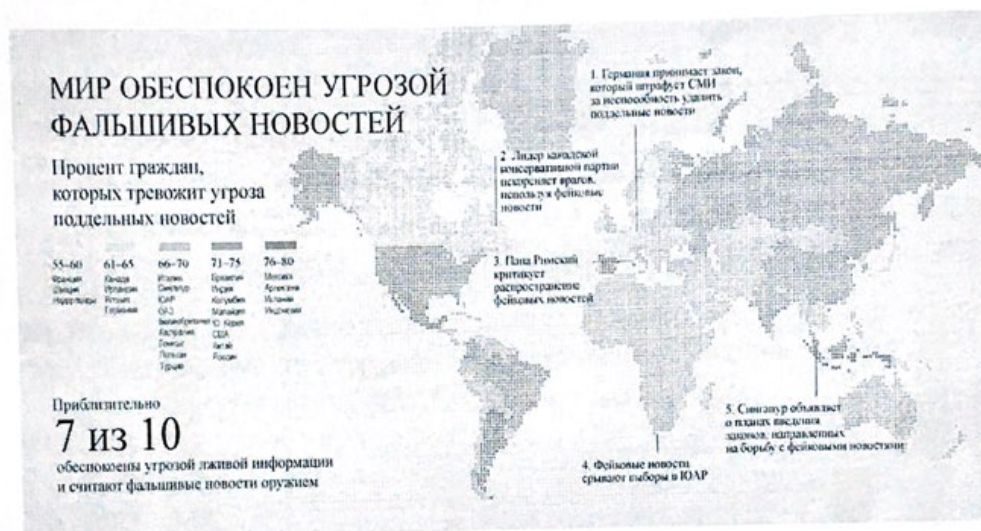
Рис. 1. Распределение стран и административных единиц в мире по степени угрозы фальшивых новостей, 2018 г.

6-12. Ознакомьтесь с материалами и выполните задания.