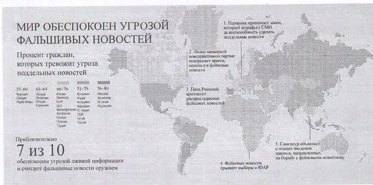
Рис. 1. Распределение стран и административных единиц в мире по степени угрозы фальшивых новостей, 2018 г.

6-12. Ознакомьтесь с материалами и выполните задания.