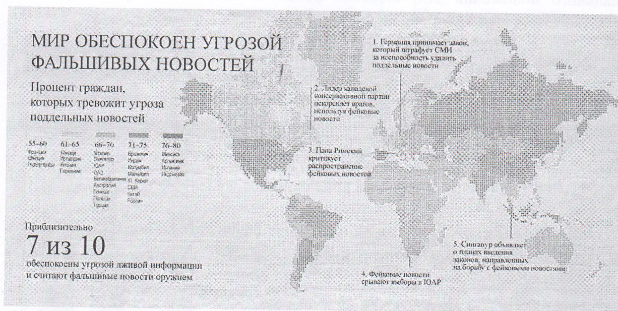
Рис. 1. Распределение стран и административных единиц в мире по степени угрозы фальшивых новостей, 2018 г.

6-12. Ознакомьтесь с материалами и выполните задания.